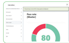
Visualisierung der gesamten Prüfergebnisse durch Diagramme