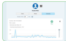
Trendanalyse pro Testpunkt

In der Lumitester Smart App können erfasste Daten in Trendanalysen angezeigt werden. Daten werden automatisch grafisch dargestellt und Bestehensraten können visualisiert werden. Mitarbeiter werden ein größeres Hygienebewusstsein entwickeln und einen Umwelthygiene-Standard aufrechterhalten, welcher das Vertrauen in Ihr Unternehmen stärkt.